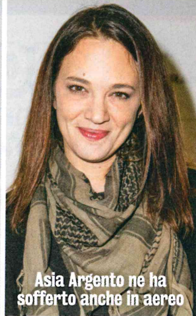
Asia Argento ne ha sofferto anche in aereo

DOLORE SUBDOLO A ds., Asia Argento, 42: ha confessato sui social di soffrire di fibromialgia che, qualche tempo fa, le ha reso impossibile un volo per Berlino. Sotto, l'attore Morgan Freeman, 80, ha sviluppato i sintomi della fibromialgia dopo un incidente d'auto. È stato costretto a rinunciare ad alcune passioni, come andare a cavallo o in barca.